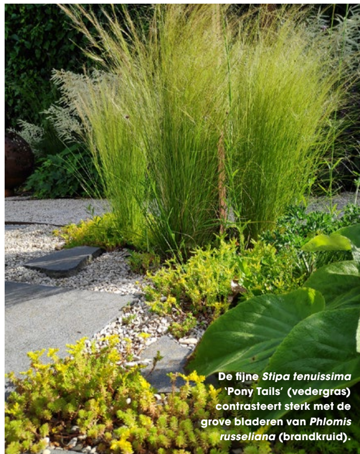
De fijne Stipa tenuissima ‘Pony Tails’ (vedergras) contrasteert sterk met de grove bladeren van Phlomis russeliana (brandkruid).