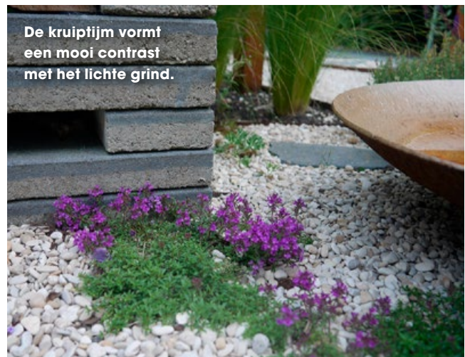
De kruiptijm vormt een mooi contrast met het lichte grind.