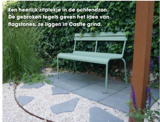
Een heerlijk zitplekje in de ochtendzon. De gebroken tegels geven het idee van flagstones, ze liggen in Castle grind.